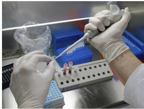
Slika 5. Laboratorijska dijagnostika bruceloze.

Svaki pobačaj u stadima ovaca treba da bude uzbuna na brucelozu iako i druge bolesti kao što je npr. Q groznica mogu izazvati slične simptome pa je zbog toga neophodno postaviti laboratorijsku dijagnozu.