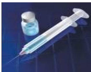
Slika 5. Vakcina

B. melitensis u zdravo stado najčešće unese zaražena životinja zbog čega je neophodno ispitivanje novonabavljenih životinja. Kontrola bruceloze može se vršiti testiranjem životinja i uklanjanjem pozitivnih reaktora iz stada. Interesantno je istaći da zaražene koze nakon pobačaja ili normalnog poroda još dva do tri mjeseca vaginalnim iscjedkom izlučuju uzročnika, dok je taj period kod ovaca kraći i obično traje 2 do 3 sedmice. Zbog toga je neophodno pozitivne reaktore što prije ukloniti iz stada, pobačeni materijal ukloniti i spaliti a sva mjesta koja su bila izložena zaraženim životinjama ili kontaminiranim pobačenim materijalima neophodno je temeljito očistiti i dezinficirati (većina komercijalnih dezinficijensa kao što su otopina hipoklorita, 70% etanol, izopropanol, jodofori, 2% do 3% kaustična soda i drugi učinkovito djeluje na brucele). Čišćenje pribora i opreme (veterinara, ljekara) vrši se suhom toplotom [160-170°C najmanje 1 sat]. Otopine se mogu dekontaminirati kuhanjem kroz 10 minuta. Inaktivacija uzročnika u tečnom stajnjaku uspješno se može provesti za 2 do 4 sedmice primjenom ksilena (1ml/litar) kalcium cianamida (20 kg/m 3 ).