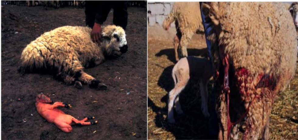
Slika 4. Simptomi bruceloze ovaca.