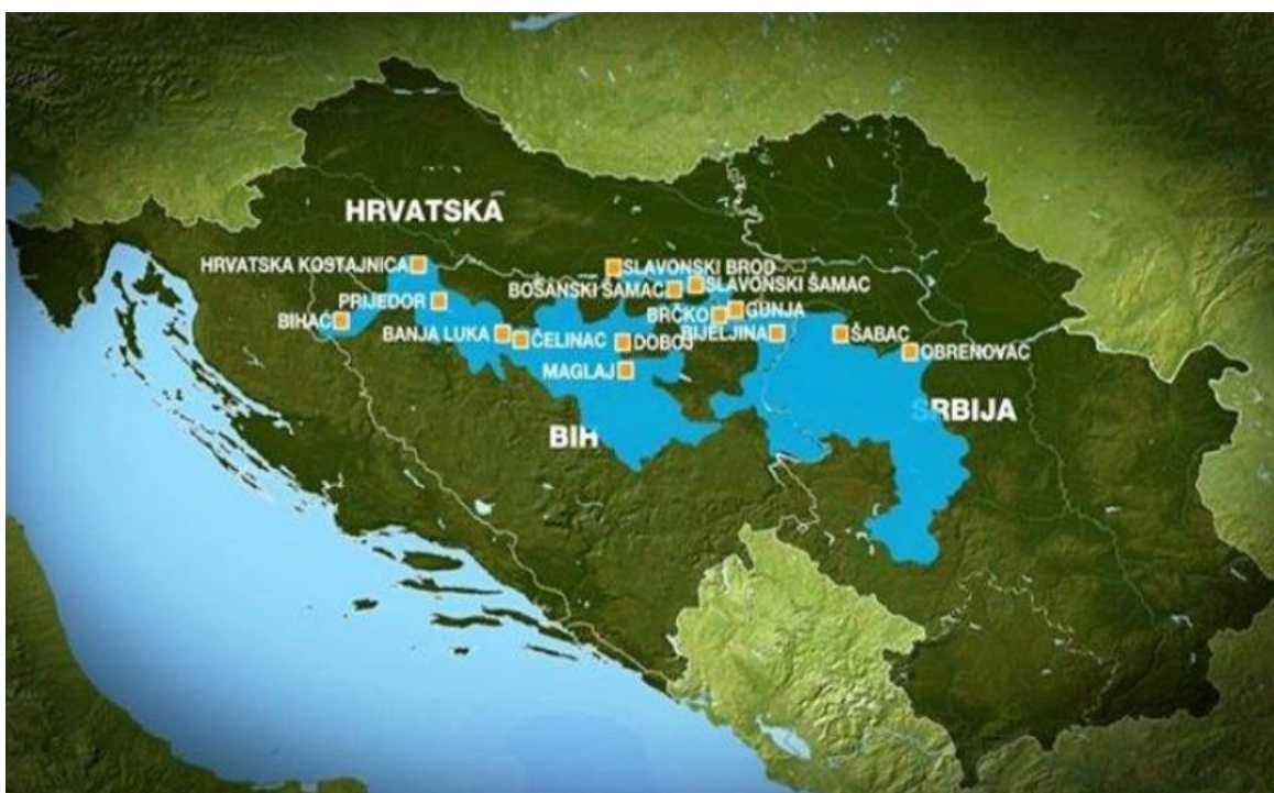
Slika 1. Područje pogođeno poplavama u maju 2014. godine

Katastrofalne poplave, uzrokovane padavinama koje su premšile do sada zabilježene pojave, u periodu od 14. do 19. maja 2014. godine, su pogodile šire područje sliva rijeke Save u Bosni i Hercegovini - BiH, Republici Hrvatskoj i Republici Srbiji. Poplave su zahvatile cijelo područje BiH koje pripada slivu rijeke Save i izazvale su gubitak 23 ljudska života i enormno velike materijalne štete. Na slici br. 1. je prikazano područje pogođeno poplavama u BiH, Hrvatskoj i Srbiji.