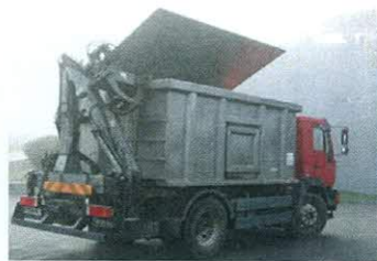
Kamion za sakupljanje leševa