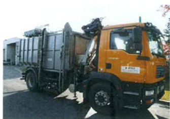
Kombinovano vozilo za prevoz leševa i pražnjenje manjih kontejnera