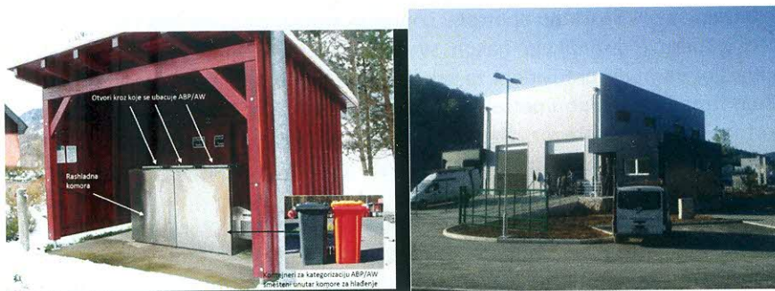
Međuobjekti za životinjske nusproizvode

Objekti u kojima se skladište dobiveni proizvodi namijenjeni: