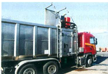
Kamion za pražnjenje manjih kontejnera zapremine od 240 do 660