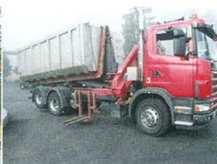
Kamion za prevoz velikih izmjenjivih kontejnera za ABP/AW