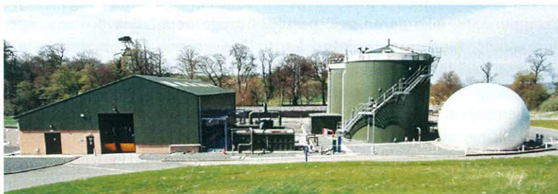
Objekat za proizvodnju biogasa

Zahtjevi u pogledu lokacije biogasnih postrojenja su da se mora nalaziti na određenoj udaljenosti od područja gdje se drže životinje, tako da se smanjerizici od širenja bolesti koje se mogu prenijeti na ljude ili životinje iz objekta za proizvodnju biogasa i da u svim