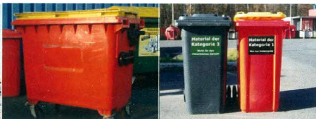
Kontejneri za ABP/AW