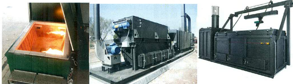
Oprema za spaljivanje (insineraciju) ABP/AW

Svaka linija postrojenja za spaljivanje treba da je opremljena sa najmanje jednim pomoćnim gorionikom. Ovaj gorionik mora automatski da se uključi kada temperatura gasova sagorijevanja nakon posljednjeg ubrizgavanja vazduha za sagorijevanje pada ispod 850°C. Ovaj gorionik se koristi i u toku operacija na pokretanju pogona i prekidu rada kako bi se osiguralo održavanje temperature od 850°C u zavisnosti od situacije u toku cjelokupnog trajanja ovih operacija i sve dok se otpad koji nije izgorio nalazi u komori za sagorijevanje.